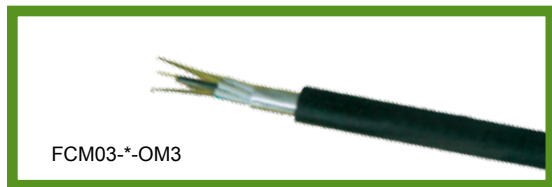
室外层绞式非铠光缆